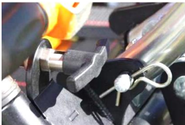
Posizione orizzontale (sbloccata) in fase di montaggio, stazionamento e smontaggio.