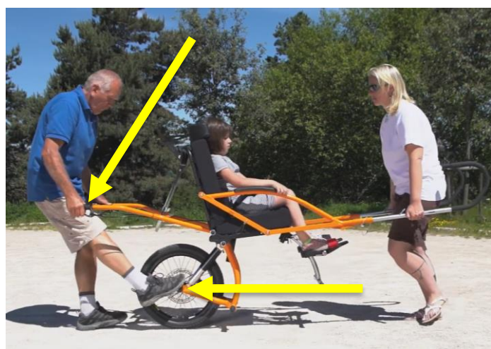
Nel passaggio da stazionamento a marcia tenere sempre il freno bloccato e aiutarsi con il piede