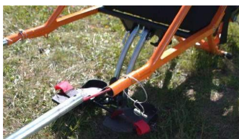
16. Aprire i bracci laterali ed infilarle le due parti