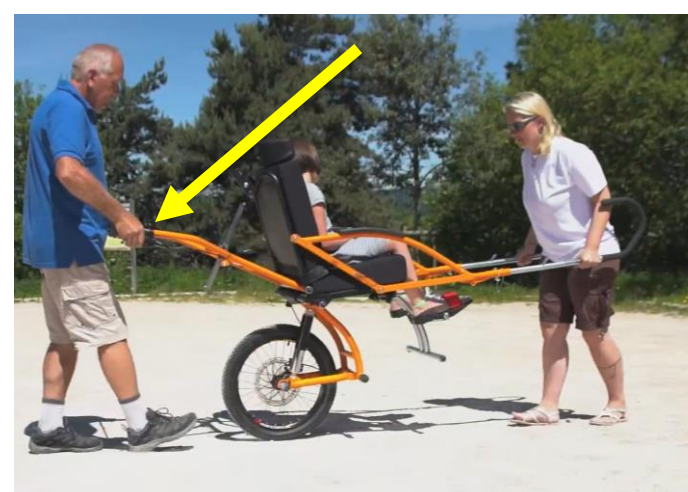
Nel passaggio da marcia a stazionamento tenere sempre il freno bloccato

Prima di muoversi controllare SEMPRE che la maniglia sia in posizione verticale