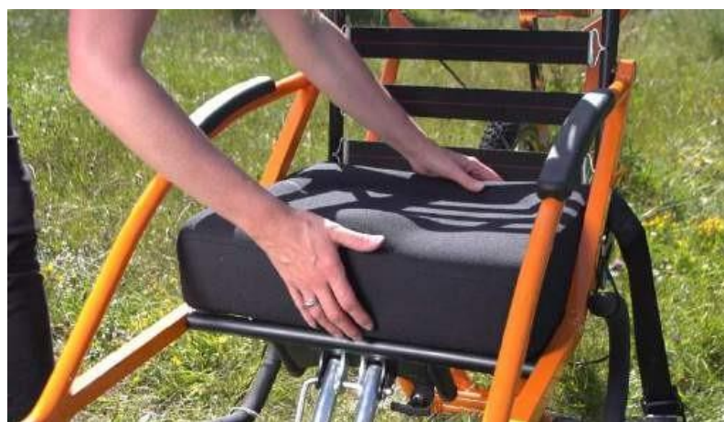
13. Posizionare il cuscino della seduta