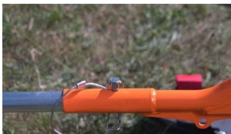
17. Bloccare i bracci con la coppia di sicurezza di sicurezza