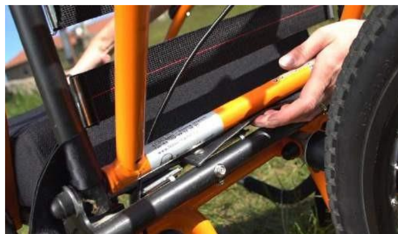
14. Far passare il sistema d'attacco sotto lo schienale e premere sugli automatici a pressione