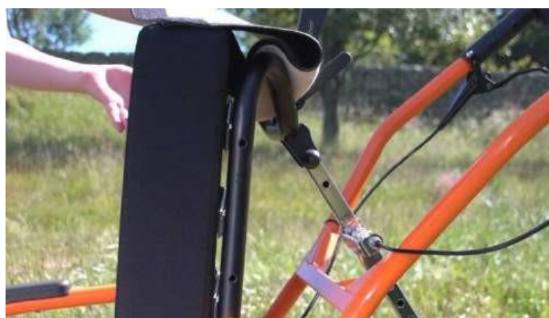
15. Posizionare il cuscino dello schienale passando la fodera in tessuto dietro lo schienale e fissarlo con la striscia di velcro